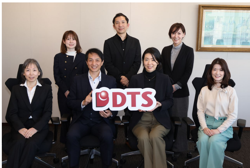
健康推進室メンバー

2018年に「健康企業宣言」を行うとともに社内に「健康推進室」を設置し産業医と保健師が常駐、社員が身体的な不調やメンタルヘルスに関することについて速やかに相談できる体制を整備しています。